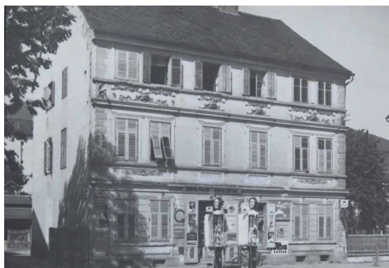
Das Werkhaus in der Wienerstraße vor dem Umbau 1935

Joachim Hainzl (Hg.): Gösting einst und jetzt. Zeitzeug*innen erzählen. 260 Seiten mit zahlr. Abb. ISBN 978-3-903425-01-9. Euro 15,00