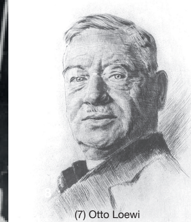
(7) Otto Loewi