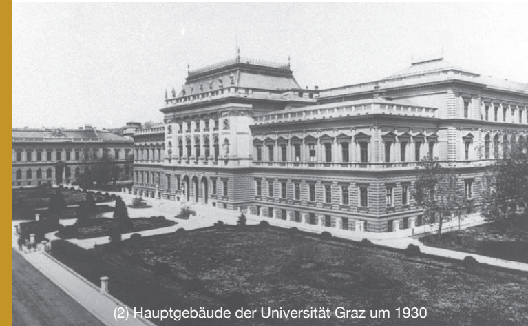
(2) Hauptgebäude der Universität Graz um 1930

auf dem Campus der Universität Graz für 15 von der Universität vertriebene jüdische Studierende und Lehrende