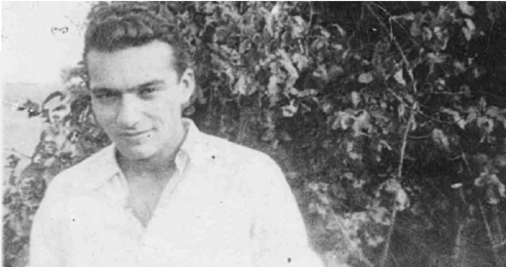
Jura Soyfer 1936 im Wiener Stadtpark