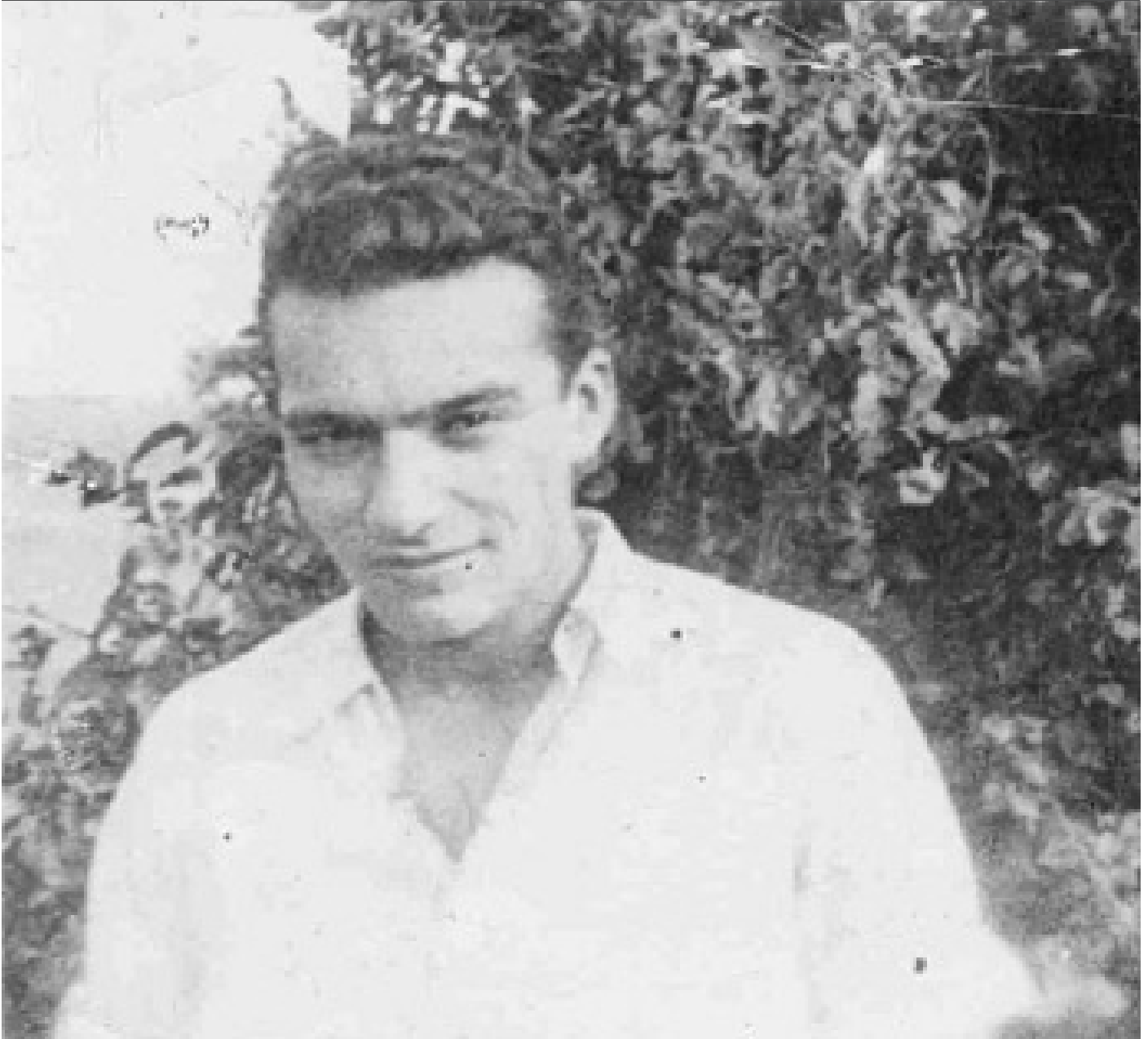
Jura Soyfer 1936 im Wiener Stadtpark

© Dokumentationsarchiv des österreichischen Widerstands, DÖW 00813-04