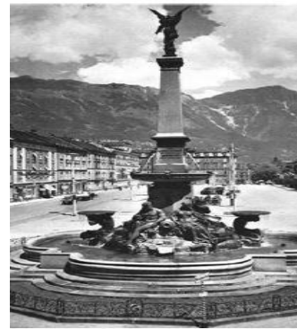
Abb.4: Alter Vereinigungsbrunnen