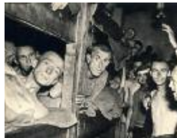
Befreiung des KZ Mauthausen