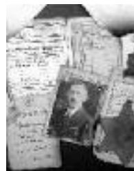
Erschießungen, Hofamt Priel