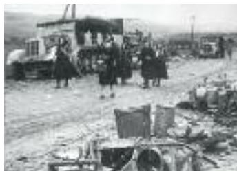
Auf der Flucht