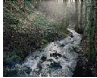
Hofamt Priel (NÖ)