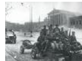
Sowjetische Soldaten vor dem Parlament