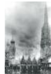
Brennender Stephansdom