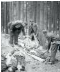
Opferbergung im Lager Gunskirchen