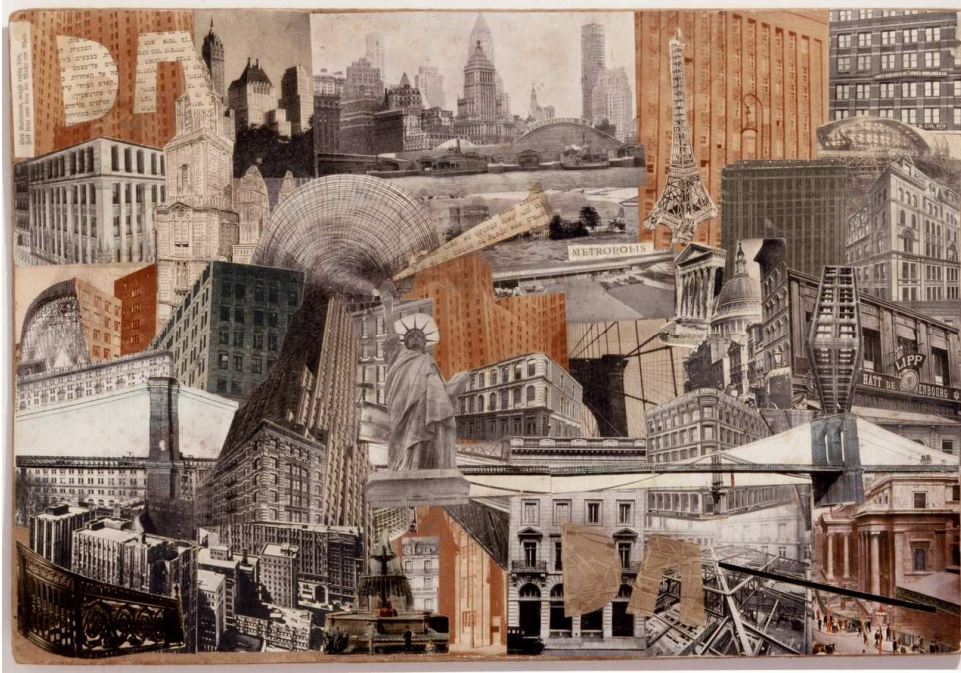
Erwin Blumenfeld, Metropolis, 1930;