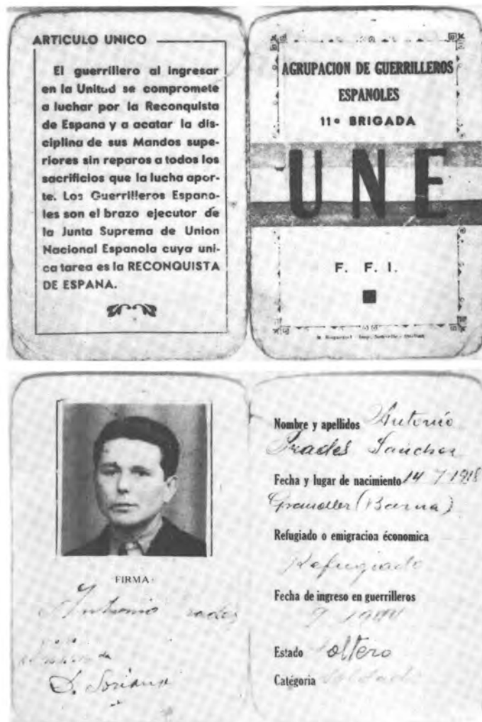
Abb. 10 Ausweis der FFI, der Innerfranzösischen Streitkräfte, lautend auf Antonio Prades Sanchez. Hinter diesem Pseudonym verbirgt sich G.E.