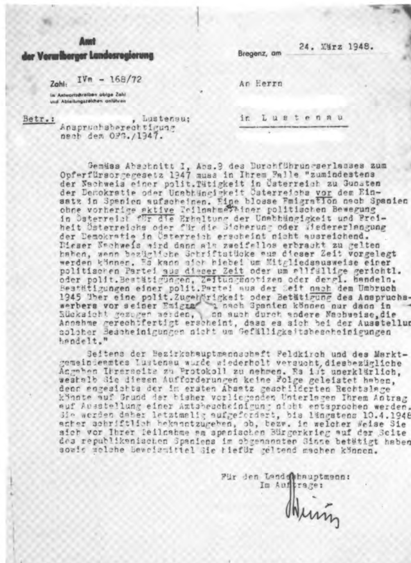
Abb. 17 Schreiben des Amtes der Vorarlberger Landesregierung an einen Vorarlberger Spanienkämpfer.