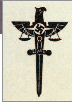
Symbol der NS-Justiz