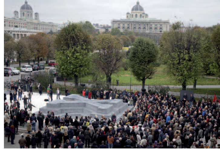
Am 11. September 2009 enthülltes mobiles Deserteursdenkmal auf dem Wiener Heldenplatz. Die Klammern symbolisieren das Fehlen von Wissen, Auseinandersetzung und Gedenken.