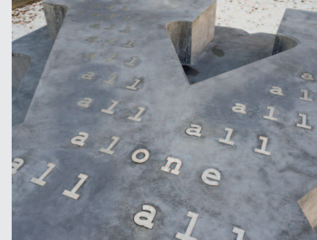
© Kunst im öffentlichen Raum GmbH, 2014