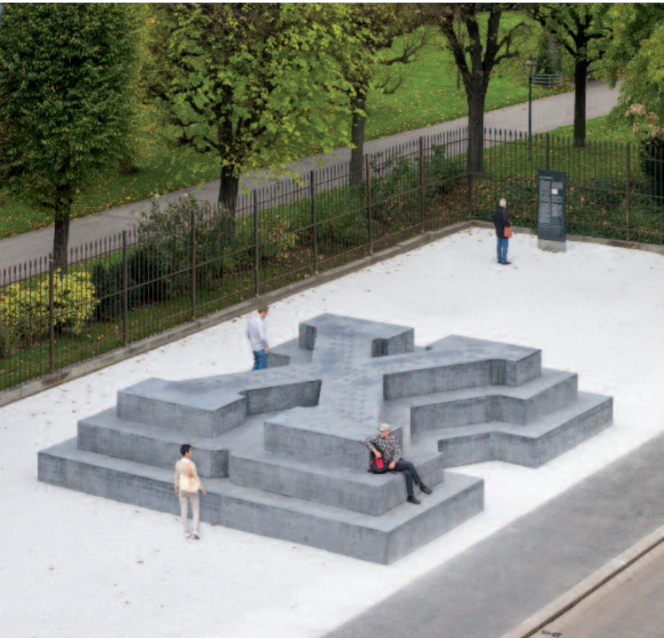
Denkmal für die Verfolgten der nationalsozialistischen Militärjustiz

Am 24. Oktober 2014 wurde auf dem Ballhausplatz im Herzen Wiens mit einem Staatsakt das Denkmal für Deserteure und andere Verfolgte der NS-Militärgerichtsbarkeit eröffnet. Denkmalsetzerin ist die Stadt Wien. Der in den Beton eingelassene Text all alone zitiert ein Gedicht des schottischen Künstlers Ian Hamilton Finlay (1925 – 2006). Sockel und Inschrift inszenieren die Situation des einzelnen Menschen gegenüber gesellschaftlichen Ordnungs- und Machtverhältnissen. Bedroht von Anonymisierung und Auslöschung, die ihn zum »X« in einer Akte werden lassen, ist seine Position dennoch zentral. 70 Jahre nach Kriegsende erweist das Denkmal denjenigen Respekt, die eigene Entscheidungen treffen und sich der Fremdbestimmung widersetzen. Der Künstler Olaf Nicolai hat mit Bedacht nur einen Sockel geschaffen; wer ihn betritt, wird Teil des Denkmals – und steht symbolisch für das eigenverantwortlich handelnde Individuum.