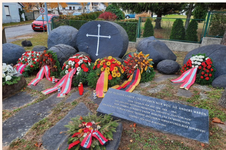
Mahnmal in Lackenbach

Shuttleservice von Lackenbach zum Hauptbahnhof Wien